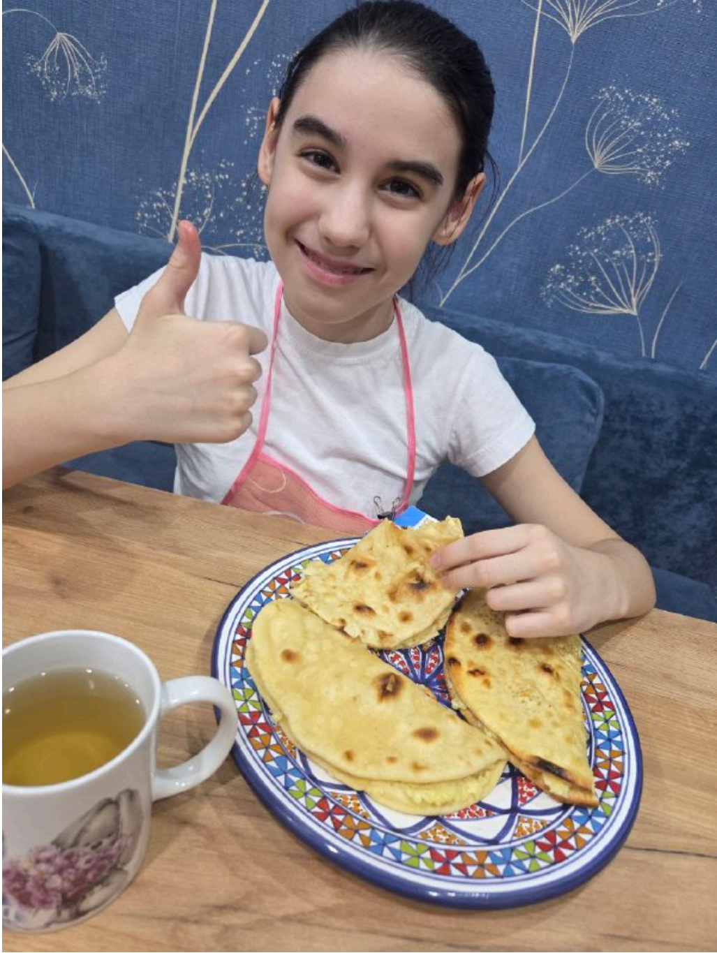
С чаем – ммммм...