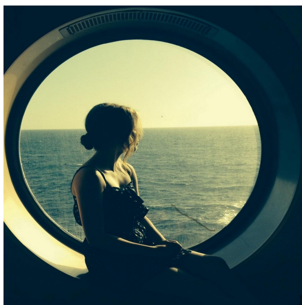
Look through the porthole - смотреть в иллюминатор