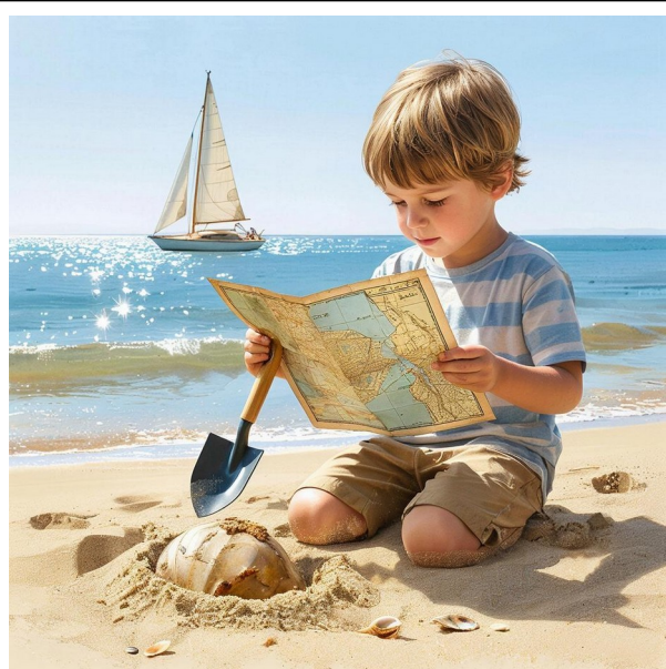
Look for treasure - искать сокровища