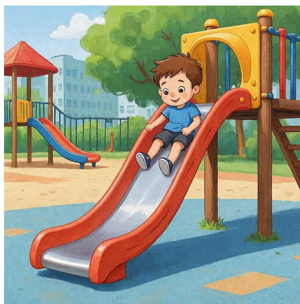
Slide down - скатываться