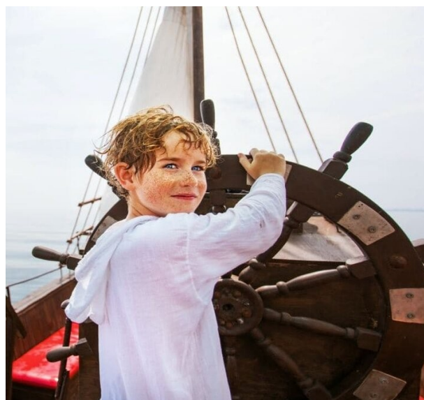
Steer the wheel - крутить штурвал