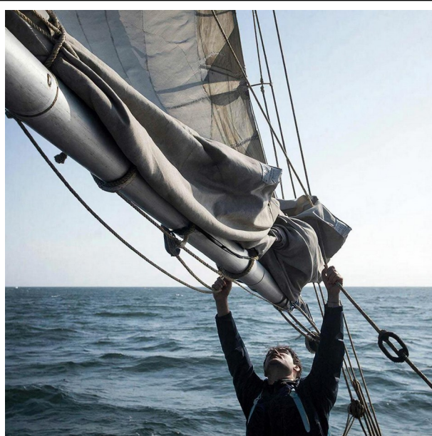
Set sails - поднимать паруса