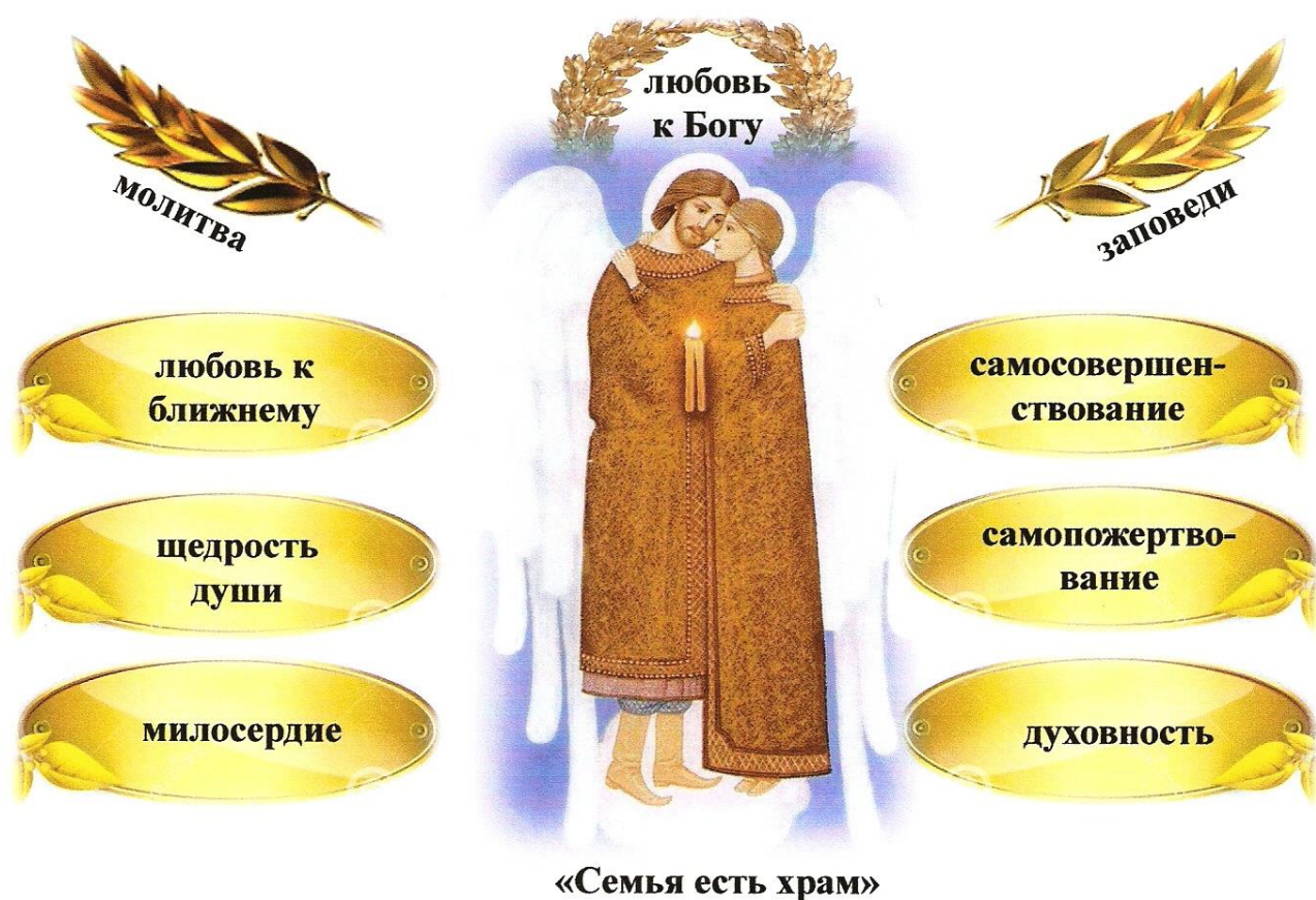
Рисунок 5 – Концепт «Семья» в «Повести о Петре и Февронии Муромских» 2

Заповедь и молитвы, словно два крыла, переносят содержание концепта «Семья» из «Повести о Петре и Февронии Муромских» в сознание читателей, демонстрируя лучшие качества, вырабатываемые в православной богоугодной семье, в которой, наверняка, если не родиться, то побывать хотел бы каждый. В целом это содержание можно представить следующим образом (Рисунок 5).