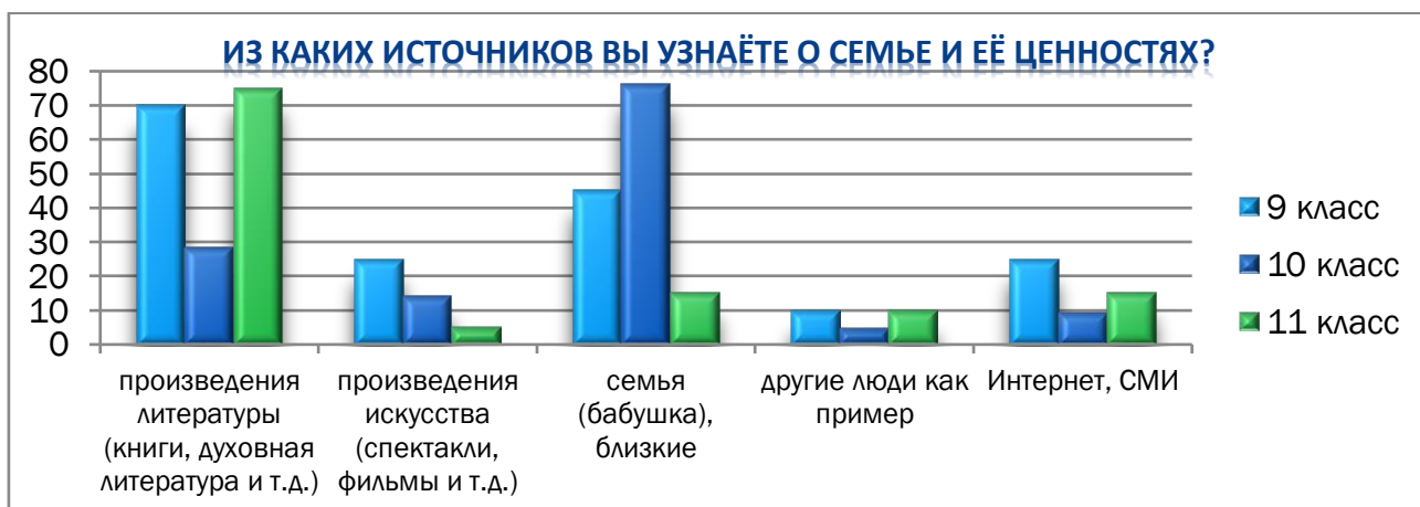
Диаграмма 3 – Источники формирования представлений о семье 2

Следующий вопрос об источниках информирования позволил выявить и источник таких убеждений – обучающиеся 10 класса не утруждают себя необходимостью черпать знания о семье из книг (Диаграмма 3).