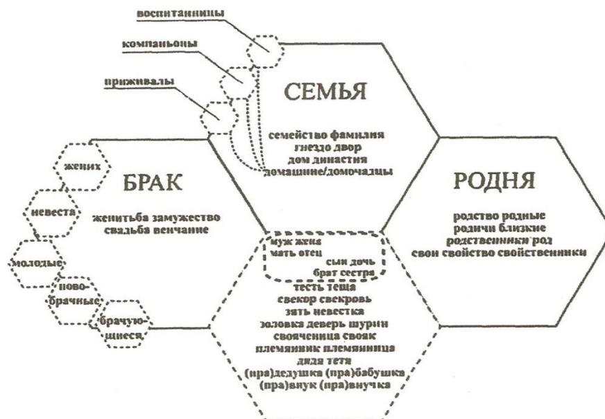
Рисунок 1 – Ключевые компоненты концепта «Семья» 1

Постараемся наглядно представить концепт «Семья» и его ключевые компоненты, такие как брак, родня, а также менее крупные – муж, жена, отец, мать, сын, дочь, брат, сестра... (Рисунок 1):