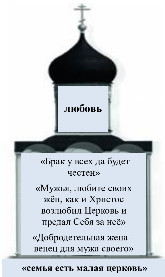
Рисунок 3 – Концепт «Семья» в произведениях духовной литературы 1

Такая трактовка семьи очень уместна для того, чтобы наглядно представить концепт в произведениях духовной литературы (Рисунок 3).