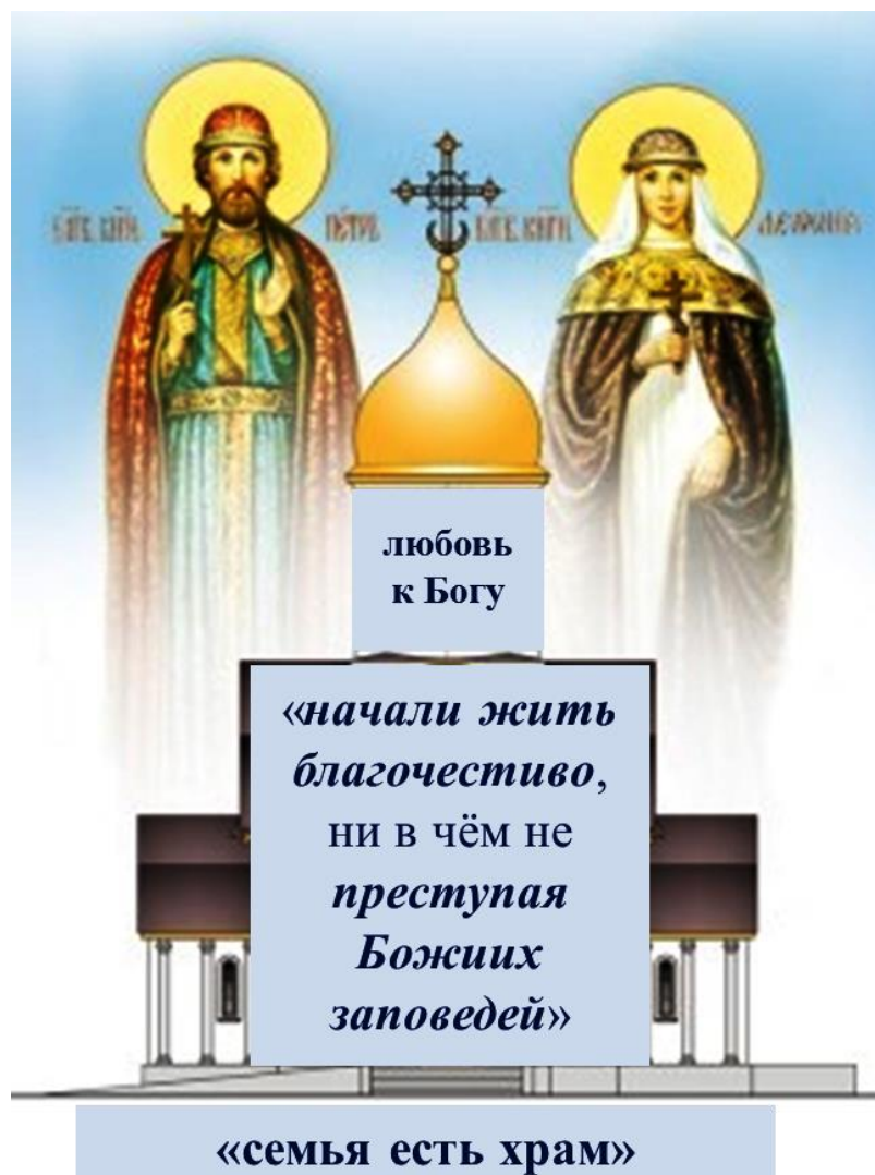
Рисунок 4 – Концепт «Семья» в «Повести о Петре и Февронии Муромских» 1

Всё это является ярким свидетельством не только неповторимых душевных качеств героев, но и неподдельной любви к Богу, что и транслирует сознанию читателя концепт «Семья», который можно представить следующим образом (Рисунок 4).