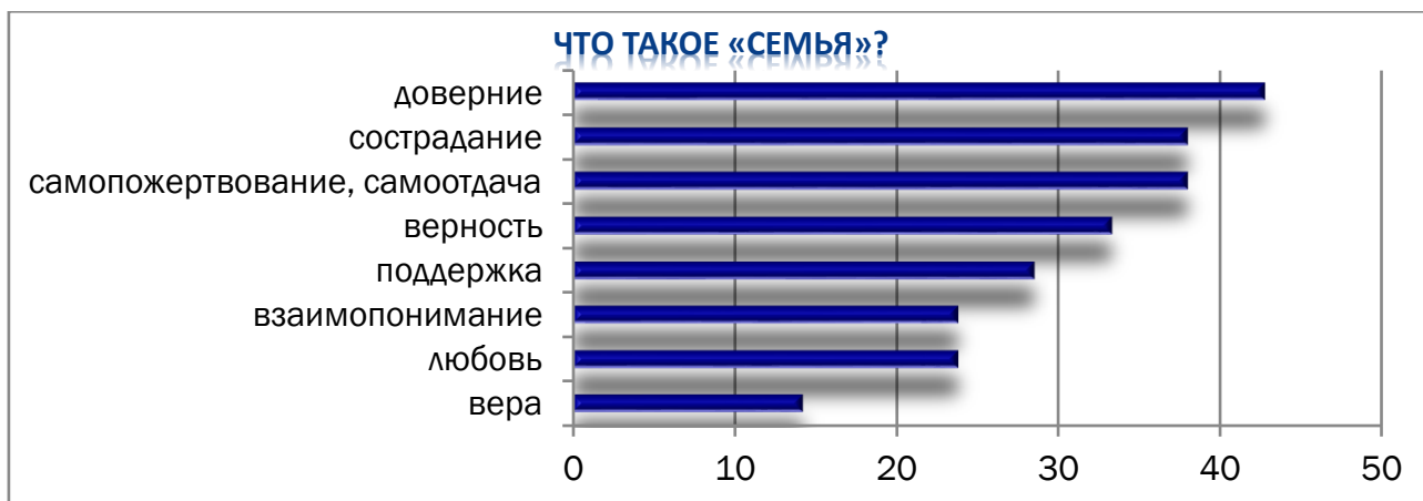
Диаграмма 4 – Понимание концепта «Семья» у обучающихся 10 класса после изучения «Повести о Петре и Февронии Муромских» 1

Таким образом, концепт «Семья», уходящий своими корнями в глубокие исторические пласты жизни народа, в его устойчивые традиции, духовность, святость, не утратил своей способности влиять на сознание современного русского человека посредством художественного слова, передавая в этом слове лучшие традиции русской семьи и взаимоотношений в ней. И особую роль в этом играют произведения духовной литературы, чьё назначение – миссия, культивирующая в нас чувство семьи, потребность в её создании, причём в соответствии с теми ценностями, которые «транслируются свыше». Примером тому как раз и служит «Повесть о Петре и Февронии Муромских», ставшая образцом и символом истинного православного супружества.