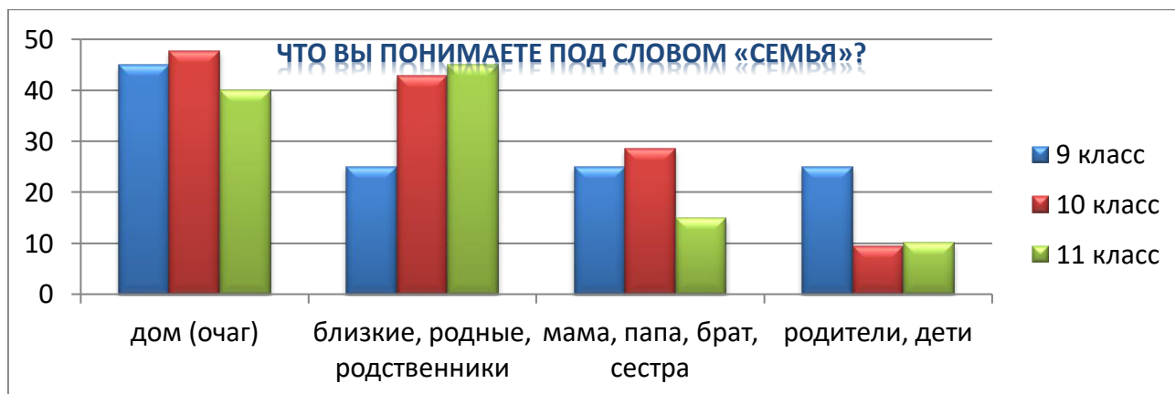
Диаграмма 1 – Понимание слова «семья» 1

Ответы получились разные (дом – очаг; муж – жена; родители – дети; братья – сёстры; родные, родственники – близкие), но практически у всех обучающихся было отмечено, что семья – это, в первую очередь, дом, родные и близкие люди, что абсолютно не удивительно (Диаграмма 1).