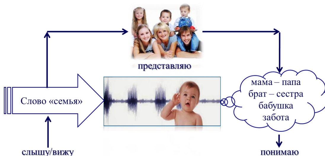
Рисунок 2 – Механизм смыслового восприятия и передачи концепта 1

Например, мы слышим: «родители – дети», «муж – жена», и в нашем сознании возникает одна ассоциация – СЕМЬЯ, причём не само слово, а именно картинка, которая содержит как наше личное представление именно о нашей семье, так и представление о семье в некотором обобщённом, переданном нам извне виде. Это, собственно говоря, и есть механизм смыслового восприятия концепта сознанием, причём как слышащего, так и видящего слово, который можно представить следующим образом (Рисунок 2):