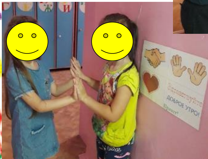
ДАЙ ПЯТЬ !