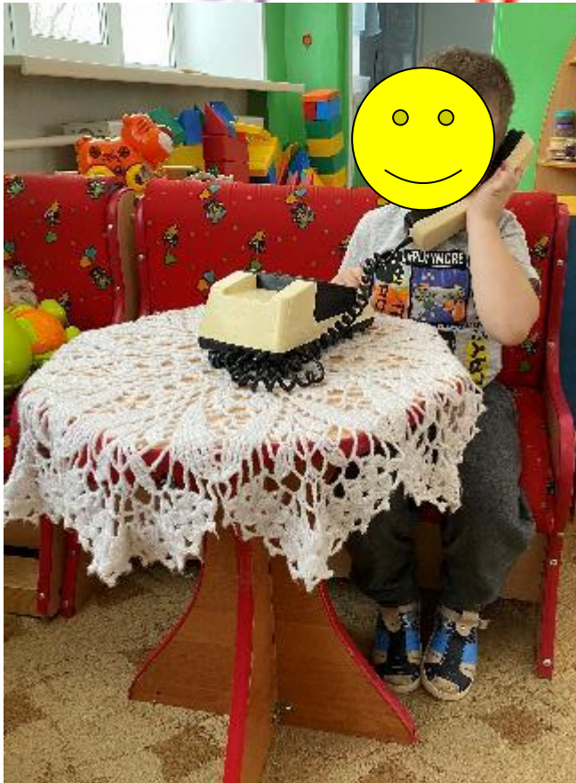
«ЗВОНОК МАМЕ» И «КОВРИК ДРУЖБЫ»