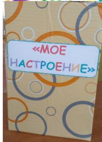
ЛЕТБУК «МОЕ НАСТРОЕНИЕ»