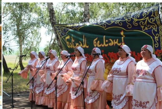
Сабантуй в Сорочинске.