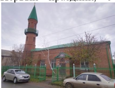
Мечеть в Сорочинске.

Как и у каждого народа, у башкир есть свои национальные праздники! Первый праздник, о котором хочется рассказать, это Ураза-байрам.