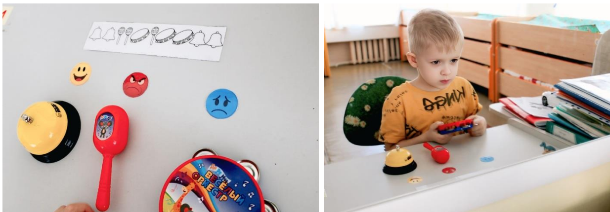
Рисунок 4 Выполнение ребенком упражнения «Эмоциональный оркестр» (вариант 2) по готовой ритмической карточке