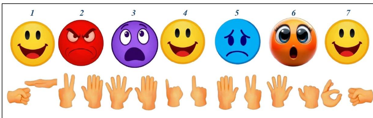
Рисунок 2 Пример готовой карточки к упражнению «Зеркало эмоций»