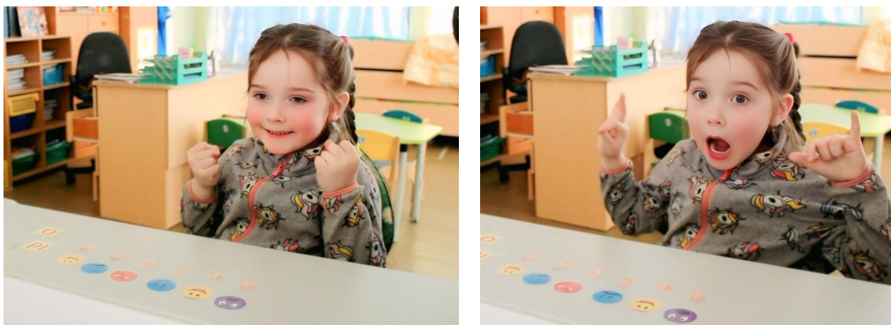
Рисунок 1 Выполнение упражнения «Зеркало эмоций»

Ребенок получает задание: глядя на свое отражение в зеркале, одновременно воспроизвести увиденную на карточке эмоцию (мимически) и повторить заданный жест. Зеркало выполняет ключевую функцию обратной связи, позволяя ребенку самостоятельно оценить правильность выполнения «эмоционального портрета» и скорректировать выражение лица. Упражнение может выполняться как по показу педагога, так и в паре «ребенок-ребенок» для развития эмпатии.